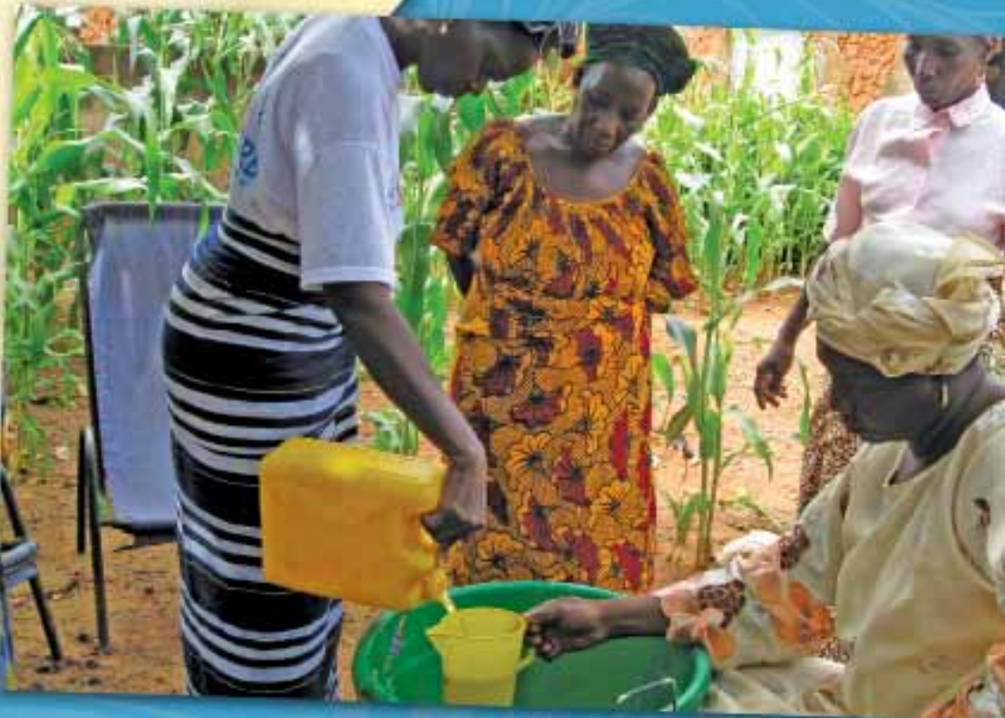
LAS VIUDAS HACEN JABON PARA VENDER COMO UNA FUENTE DE INGRESO